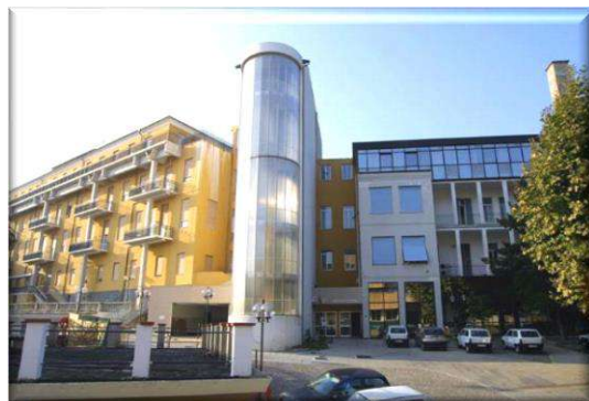
Direzione e Polo Territoriale di Chiavari