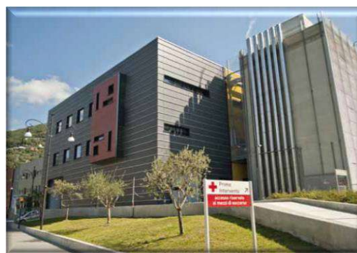
Polo Ospedaliero di Rapallo