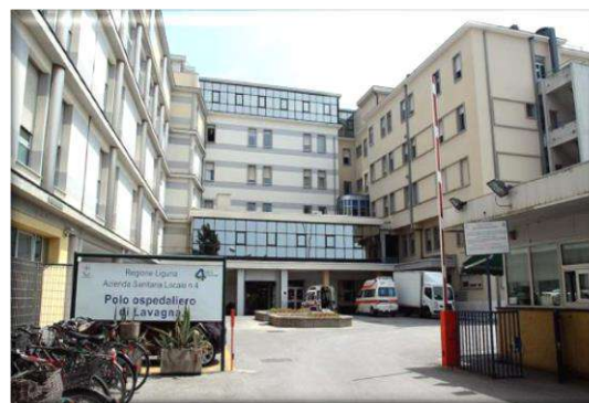
Polo Ospedaliero di Lavagna